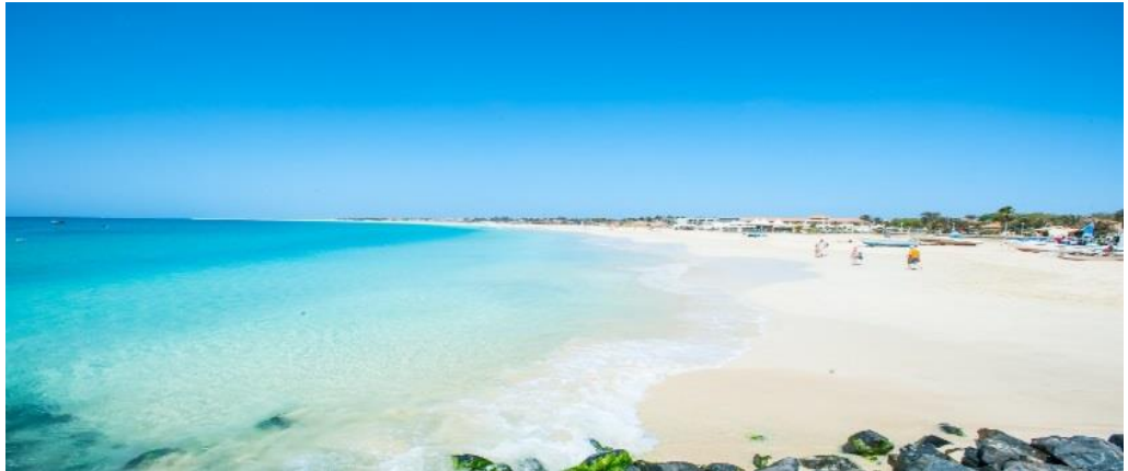
Plage de Santa Maria, Sal.

Journée libre pour profiter de la magnifique plage et des activités nautiques proposées. Nuits à l'hôtel Dunas de Sal 4* en standard et petit-déjeuner Supplément demi-pension : CHF 35.- personne/nuit